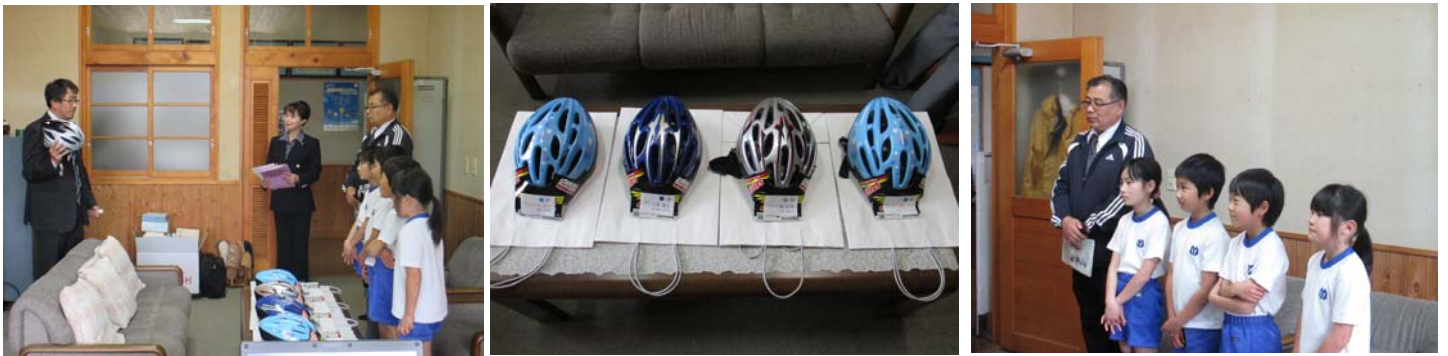
2015年4月14日 4人の児童に贈呈